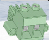
Morsetto batteria principale Principal battery terminal

Connettori di collegamento alla batteria / Battery connectors