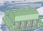
Morsetto batterie ausiliarie Auxiliary battery terminal