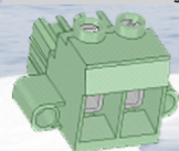
Morsetto batteria principale Principal battery terminal

Connettori di collegamento alla batteria / Battery connectors