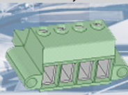
Morsetto batterie ausiliarie Auxiliary battery terminal