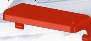
Tetto di protezione / Protection roof